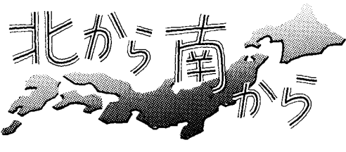
人事院月報793号より