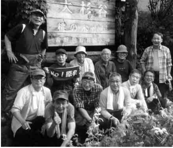
2日目山頂を目指す参加者(桃の木山の家前にて)

第54回山の集いが、8月6日(木)～8月8日(土)三重県日出ヶ岳(1,685m)を中心とした大台ヶ原で開催され、東京地連・関西地連・近畿地連の組合員や組合員OBなど21名が参加しました。