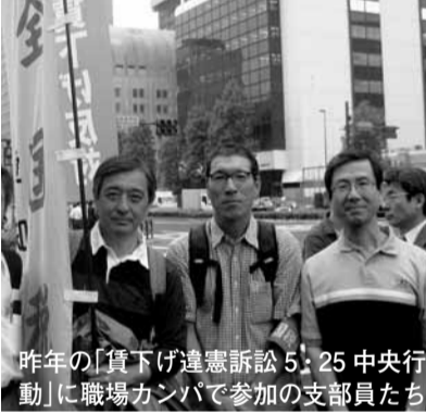
昨年「賃下げ違憲訴訟5・25中央行動」に職場カンパで参加の支部員たち

3 堅実かつ地道な組織拡大 毎年、支部新入組合員を継続的に増やし、応援団員も増やしました。(1月の加入確定者は、再加入ですが、脱退者に対する組合差別の裏返しとして「高い評価」にもかわらず、自ら再加入を決意した大きな意義は、人間関係継続の重