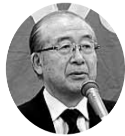
佐々木憲昭衆議院議員

来賓の方々 日本共産党・佐々木憲昭 衆議院議員/九後健治 公労連書記次長 寄せられたメッセージ 全税関労働組合・圭芳連 不公平な税制をたすか