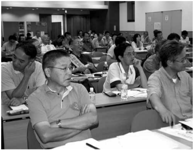
代議員の確信に満ちた発言に笑いの絶えない会場。

前大会の決定事項として①日本労働運動における産別組合への発展、②国税労働運動の発展・継承を「二つの意義」と位置付けた国家公務員一般労働組合(国公一般)への加入問題は、この一年、さらに議論と運動を重ねてきました。大会では個人として二重加盟することを職場民主主義の確立へ向けた、新たな公務産別組織めざすものとして満場一致で決定しました。