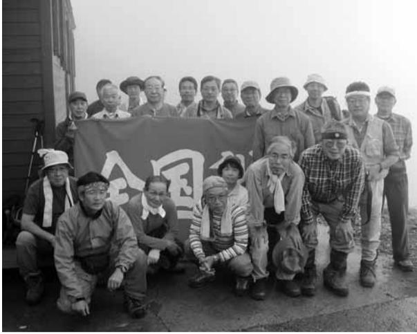
霧に包まれた槍ヶ岳小屋側でパチリと記念の写真

臨時国会でもたたかいは強めます。しかし、連合・国税労組は、人事院に対して「2013年度までの給与は労使妥結したのだから許さないと立派で、賃下げを容認するのでは、労働組合とは呼べない！」多くの職員が口を揃えています。この声を真摯に受け止めることこそ、連合・国税労組には求められているのではないのでしょうか。