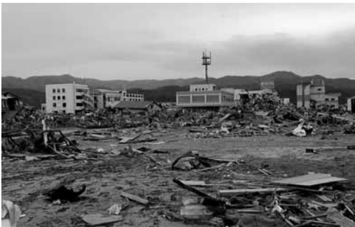
被災後の陸前高田市の惨状

2011年7月15日 大阪商工会議所副会頭・町田勝彦シャープ会長 「(原発をめぐる混乱は)海外移転を考える企業にトドメを刺す。この状態が長く続けば、日本では製造業が成り立たない」(産経ニュース) 2011年7月20日 経団連・米倉弘昌会長 「原発に一定程度依存しないと(電力不足で)国内産業がどんどん海外に逃げ、雇用が守られず、経済成長が落ちる」(毎日新聞)