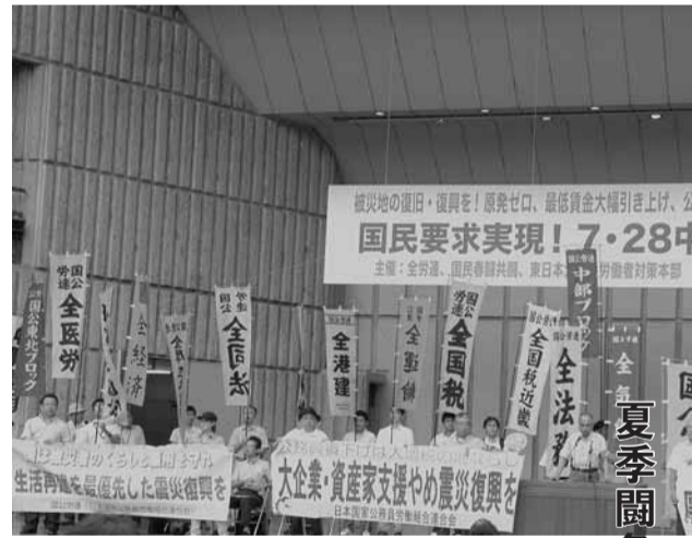
集会の壇上には、全国税と近畿地連の幟旗が

結果として被災地の産業と資源を吸い尽くす方向性が顕著となつていきます。さらに、「外国の活力を取り込」むためとしてTPP推進を示唆し、外需による地場産業・労働市場の「買いたたき」による内需の冷え込みを招き入れる内容になっていきます。いずれも、「使い捨て」が前提です。 復興財源の確保では、「限定的な税制措置」の表現で、規模は明らかにしないものの、増税路線を宣言。「基幹税などを多角的に検討」として、