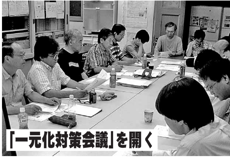
「一元化対策会議」を開く

拙速な一元化全署実施により、管理運営部門や課税内部はどうなったのか—全国税はここに焦点をあてた「一元化対策会議」を9月26日に開催し、職場の実態と問題点を掘り下げ、当面の要求をまとめました。引き続き、職場のみなさんの意見や要求等を基にさらに具体化を図り、当局に改善を求めていきたいと考えています。