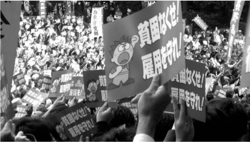
「なくせ貧困! 守れ雇用! 生活危機突破! 11・13中央行動」に5,500人が集まり、会場の日比谷野外音楽堂は埋め尽くす熱気につつまれました。