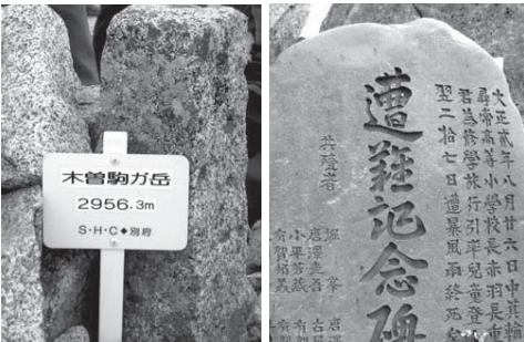
標高2956.3mの木曾駒ヶ岳と「聖職の碑」で知られる遭難碑