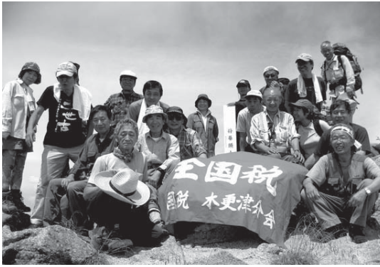
晴天にめぐまれた将棋頭山頂での参加者たち