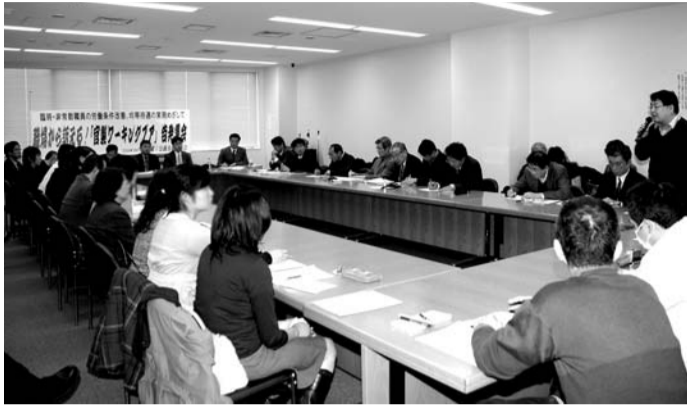
主な省庁の非常勤職員数