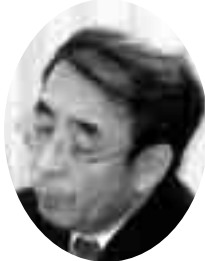
『拝啓・福田長官殿』の記事の一部を取り上げた長官の逆質問をめぐり下記のやりとりがあった。

「過去の長官発言とされたものは交渉の場で出たものなのか」、「(当時の)機関紙に掲載されていれば客観的事実だが、そうでなければ勘違いだったと考えられる」と逆質問をする一幕がありました。