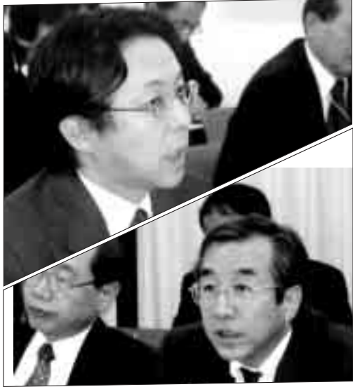
庁の対応をせまるが、反応はにぶい

全国税と沖縄国公労全税支部が共同して組織する「協議会」は、12月2日、木村長官と交渉を行った。