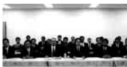
全国の声を届ける参加者