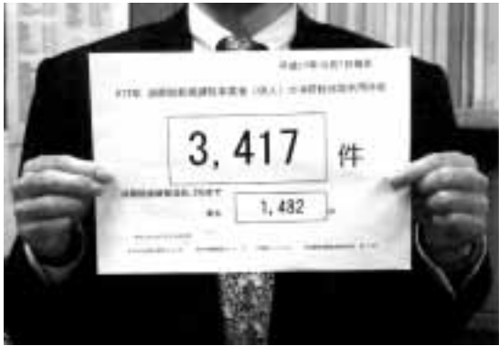
「あと1482」と書かれた紙。これを日々貼り出し、目標を煽る金沢署

会社の調査に特官が付職員ときた。あれこれ見るが何もでない。すると特官が付職員にガソリンスタンドの領収書から軽油引取税を拾えといつた。