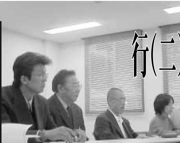
職場実態を訴え国税庁を追及する行(二)組合員の仲間

12月10、11日の2日間、東京都内で「全国税・全国行(二)集会」が開催されました。政府の定削方針のもとますます厳しくなる行(二)職員の職域確保と処遇改善などを求め、10日には国税庁と交渉を行いました。採用時の約束である超勤手当支給が仕事と共に削られていく実態、希望外の配転、部下数制限を口実にした昇格の遅れや奪われる職域拡充など、切実な要求をぶつけて庁当局を追及しました。